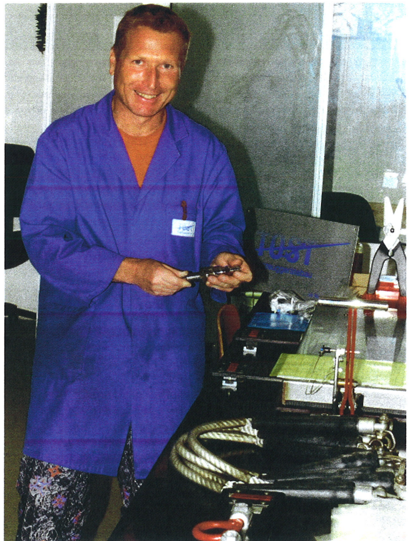
Hier sind Abseilsicherungen für Hubschrauber-Einsatzkommandos zu sehen.

Während in Privatflugzeugen Kupplungen nicht so sehr beansprucht werden, sieht das in Schulungsflugzeugen anders aus. Nach ca. 1250 Starts, was gut 10.000 Betätigungen entspricht, müssen die Schleppkupplungen unbedingt überprüft und gewartet werden. Für das Qualitäts-Management und die